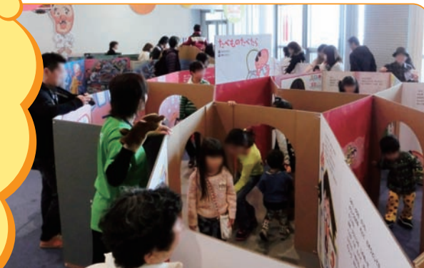
パビリオン全体イメージ