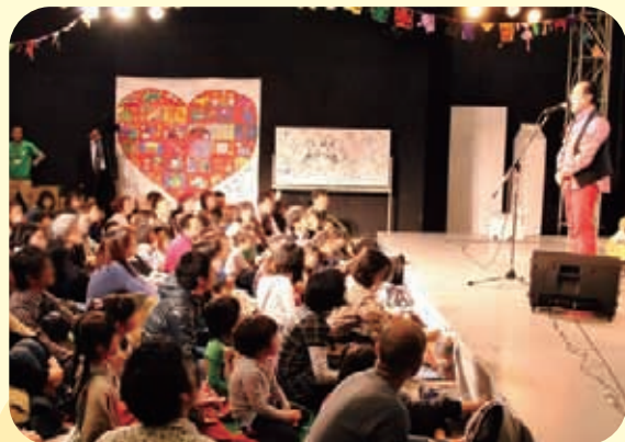
午後のコンサートでは5冊の絵本すべての文章を手がけてくださった中川ひろたかさんが登場! 会場には定員を超える150人が集まってくれました。5冊すべてを読み聞かせした後、「とても気持ちのいいコンセプトの絵本のシリーズです」と会場に向けて語ってくださいました。感無量です。